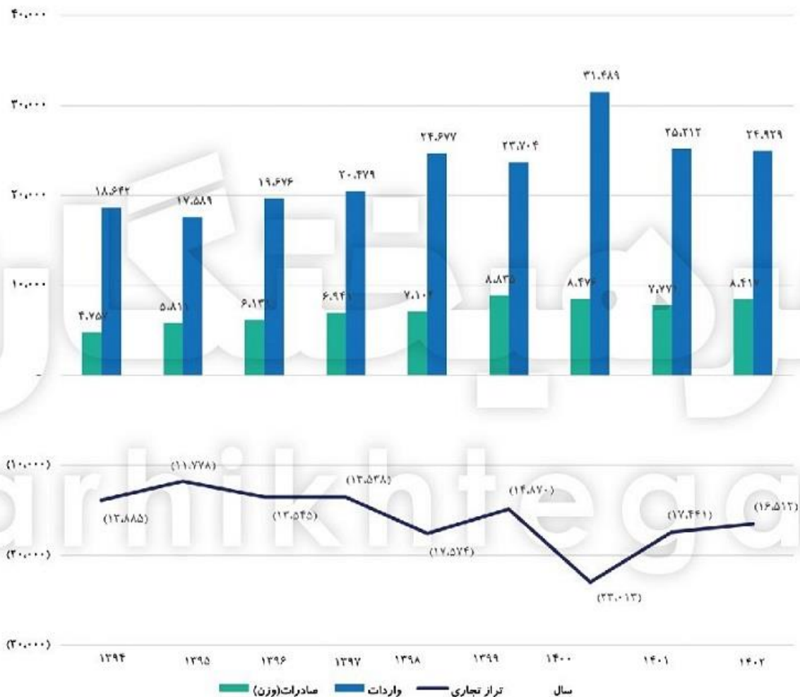
وضعیت وزنی صادرات؛ واردات و تراز تجاری بخش کشاورزی از سال ۱۳۹۴ تا ۱۴۰۲ (هزارتن)